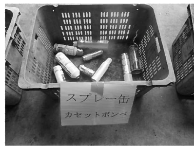
スプレー缶・カセットボンベ